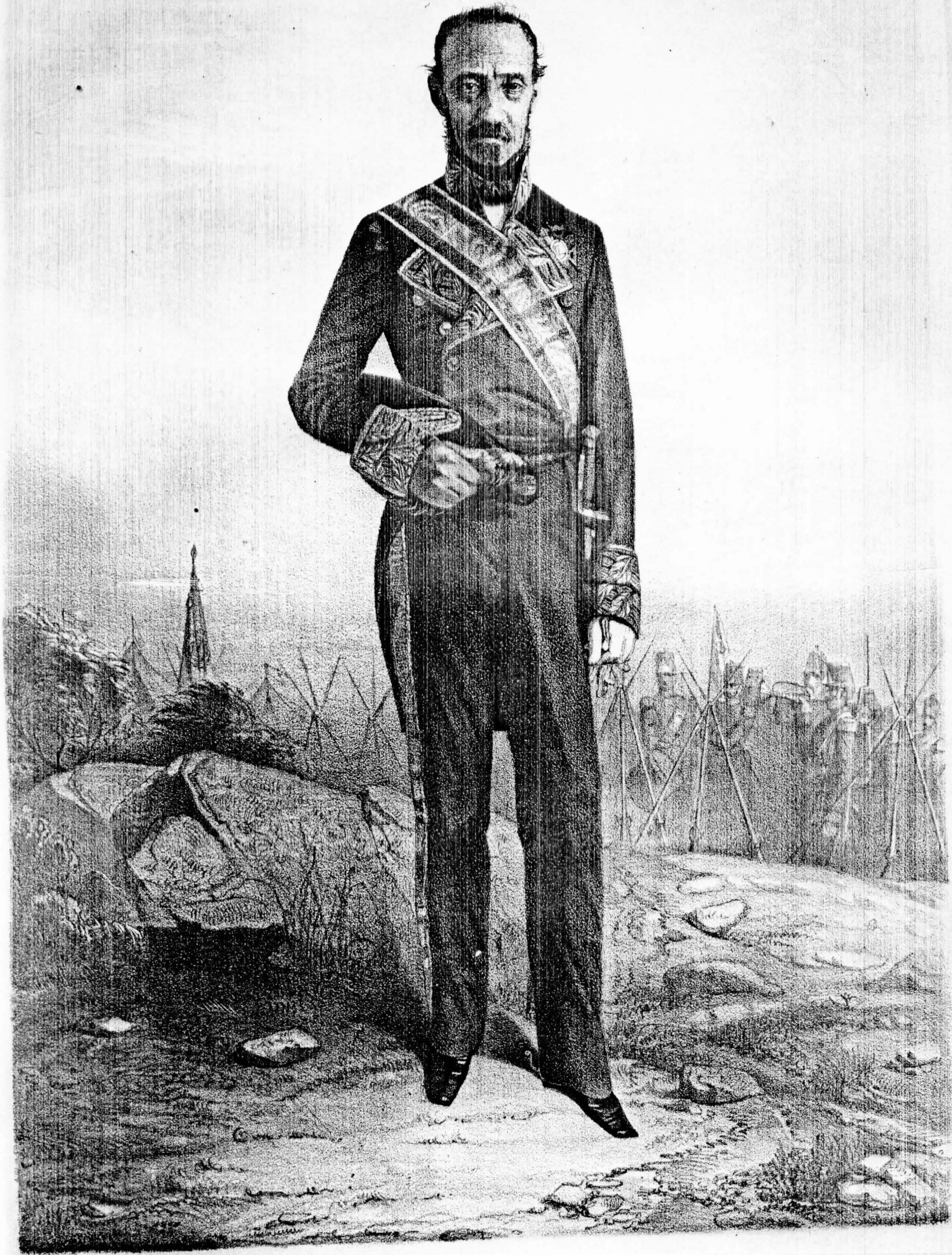
EL CAPITAN GENERAL DE SEVILLA.