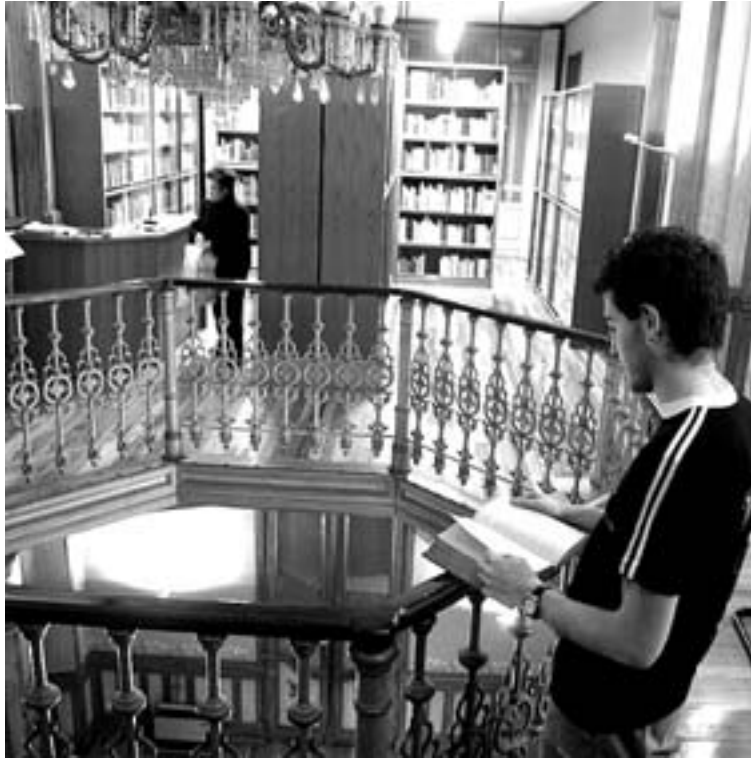
Un joven, en la biblioteca de Sancho el Sabio.

Al cabo de todo este tiempo, la ahora llamada Fundación Sancho el Sabio, propiedad de la Caja Vital, ha dado unos frutos magníficos. Ha sido pionera en sus objetivos de adquisición prácticamente exhaustiva de libros, revistas, manuscritos y demás documentación sobre Vasconia. Ha sido un baluarte para la protección de nuestro patrimonio bibliográfico y documental en Álava. Ha estado a la cabeza en la aplicación de nuevas tecnologías. Ha constituido el refugio seguro para cientos de