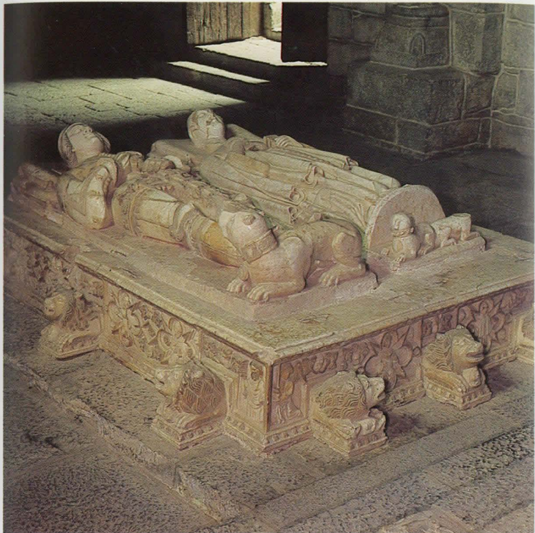
Kantzilerraren eta bere emaztearen eskultura etzanak.