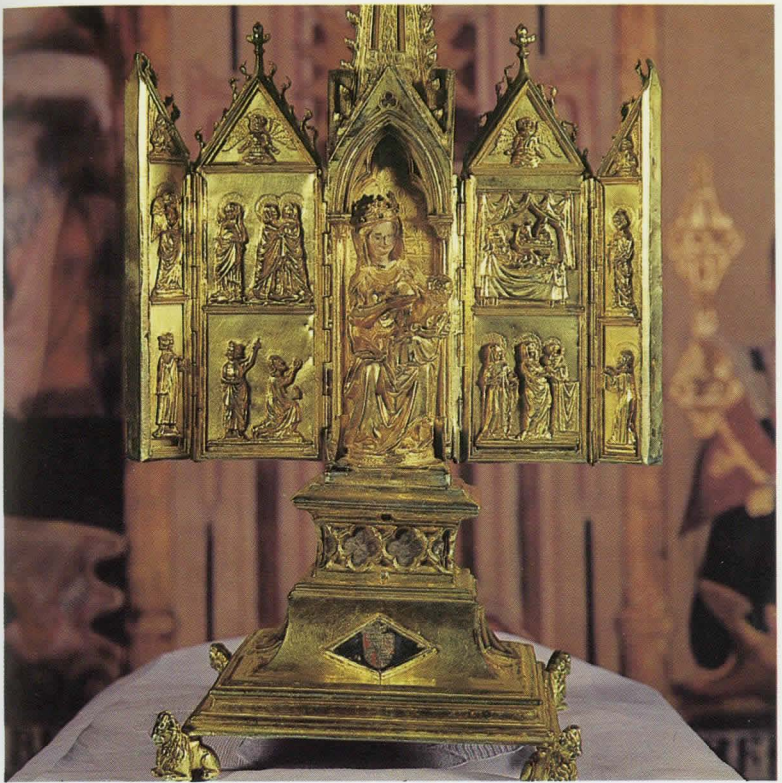
«Virgen del Cabello»ren erlikitegia.

«Nuestra Señora del Cabello» izeneko Andra Mari gurtzen duen. Andra Mariren irudia, bere fundadoreak komentuari emandako bitxirik nagusia da.