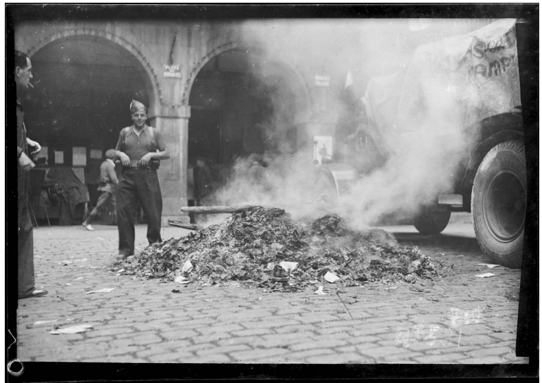
Quema de libros en la plaza Zaharra de Tolosa. 11 de agosto de 1936. Autor: C. Yanguas (AMVG) (foto 3)

Estas escenas contrapuestas nos estremecen y nos conducen a reflexionar, entre otros muchos temas, sobre la importancia de guardar y difundir los documentos, así como los pensamientos y datos que estos recogen, para que, a través del conocimiento y la información, la intolerancia vaya dejando lugar al respeto y la convivencia. Esta tarea de guardar y difundir el saber ha sido históricamente encomendada a las bibliotecas, en especial a las bibliotecas públicas sobre las que la UNESCO “proclama su fe en que sean una fuerza viva para la educación, la cultura y la información y un agente esencial para el fomento de la paz y del bienestar espiritual a través del pensamiento de hombres y mujeres” 4 .