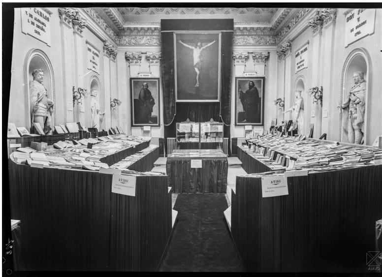
Exposición de Libros Vascos en el Salón de Plenos del Palacio de la Provincia. 8 de septiembre de 1935. (foto 2)