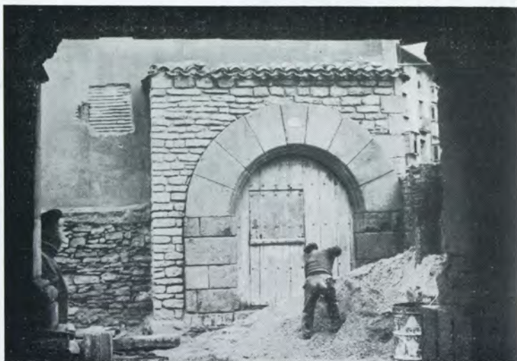
3.—Una «pieza» del jardín - museo de la Caja Municipal en la calle Chiquita.

que ruinas lamentables, tradiciones olvidadas, de las que sólo podemos pretender una recuperación de museo o archivo que acoja con amor lo que "la incuria del tiempo y de los hombres" destruyeron.