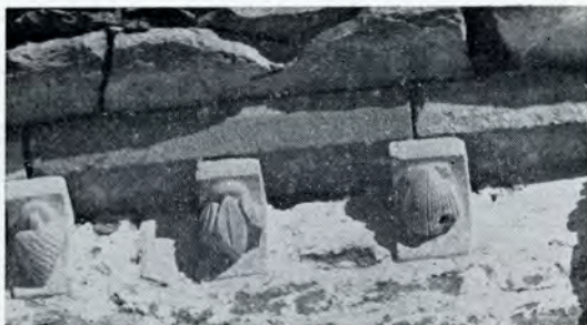
Conchas o veneras en Nuestra Señora de Ayala (Alegría de Alava).

de Santiago es la Parroquia de Santa María. La comitiva, acaso con típicos atuendos medievales, entraría por el Túnel de San Adrián y saldría de la provincia por el puente de Armiñón, atravesando y estudiando toda la ruta alavesa de romeaje. (Véase itinerario y horario en la pág. 5).