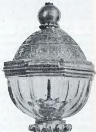
4. - El relicario de Berrostequieta.

Solamente queda un detalle por resolver: el del pago de las obras... Pero las gestiones van por buen camino. ¡Enhorabuena!