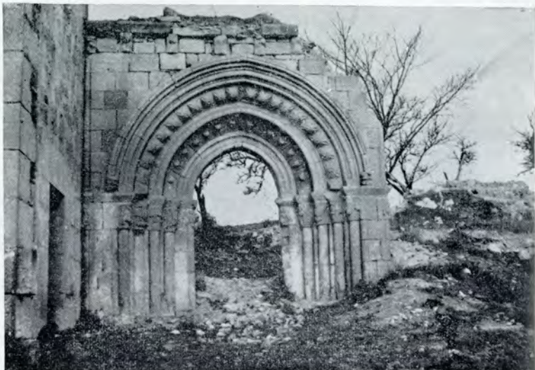
1. -Ochate, como estaba.

poníamos que se trasladase al inmediato lugar de S. Vicentejo, cuyo hastial del Oeste aparece macizo y desnudo. Allí hubiese podido adosarse la ruinosa portada de Ochate. No se nos ha atendido --como de costumbre--; y la ruinosa portada de S. Miguel de Ochate se ha trasladado al también treviñés pueblo de Uzquiano, adosándola, por las buenas, a su románica iglesia de La Asunción (Foto 2).