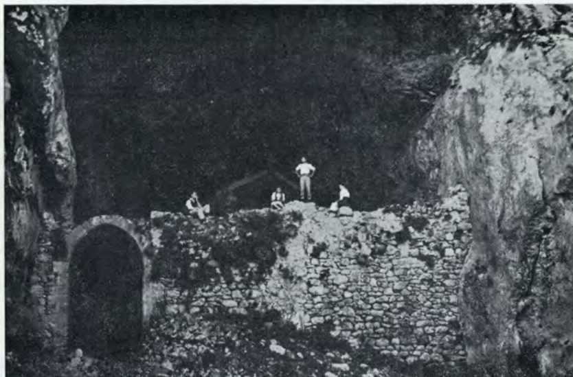
El Túnel de San Adrián, visto desde la parte «lipuzcoana», según fotografía de López de Guereñu, tomada hace unos pocos años...