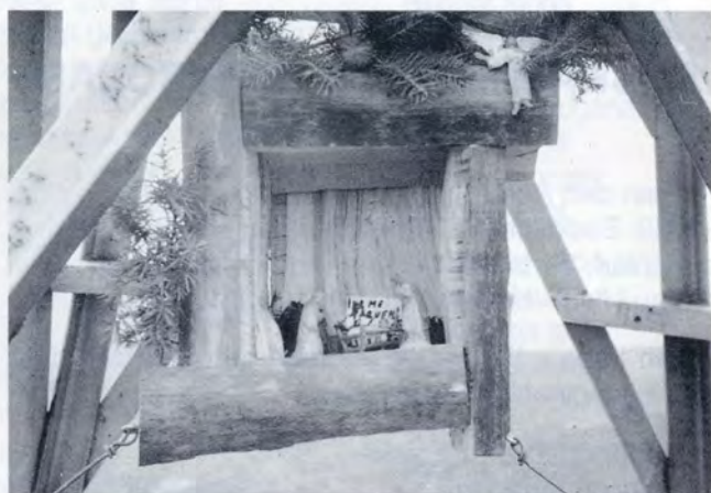
Segundo Belén de la S.E.M.I. en la Cruz de Zaldiaran.