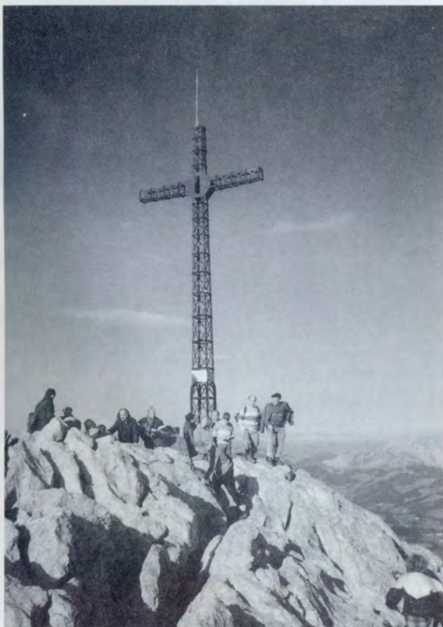
EXCURSIONES PARA EL 2.º TRIMESTRE DE 1990