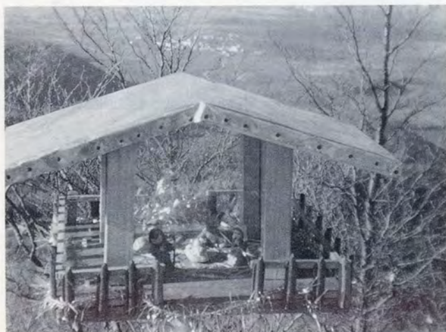
31-12-89. Belén en Itxogana