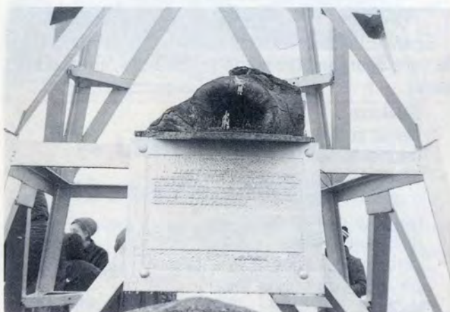
Primer Belén de la S.E.M.I. en la Cruz de Zaldiaran.

Para las próximas Navidades, esperamos poder contar con un nuevo BELEN en propiedad.