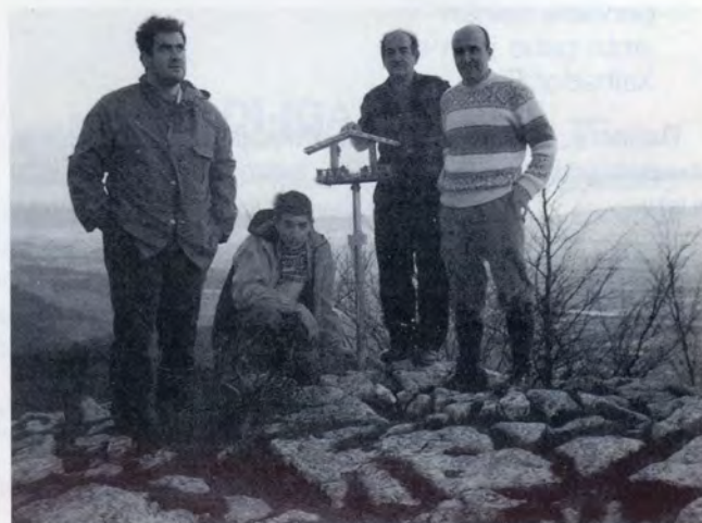
El equipo técnico después de la colocación.